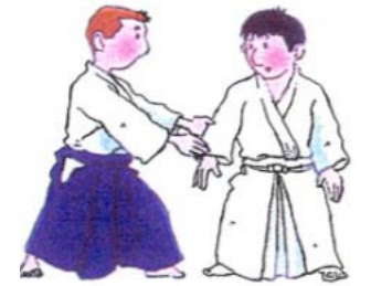
KATATE RYOTE DORI