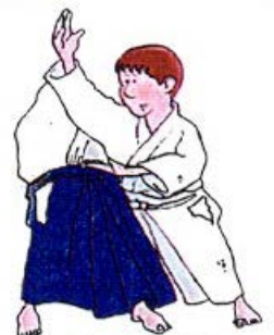
SOKUMEN IRIMI NAGE