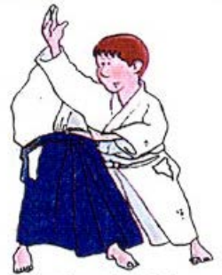
SOKUMEN IRIMI NAGE