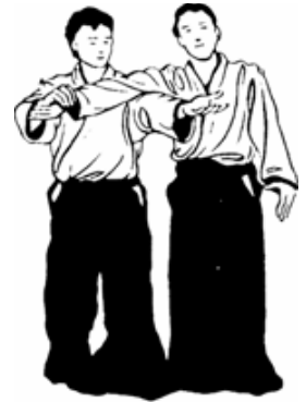
Ude kime nage