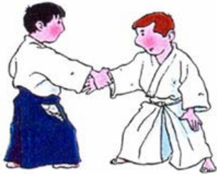
AIHANMI KATATE DORI