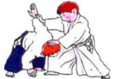
UCHI KAITEN NAGE