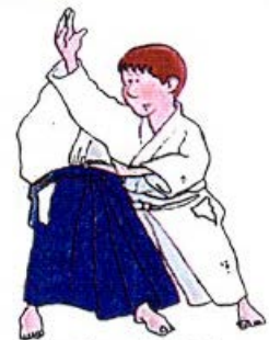
SOKUMEN IRIMI NAGE